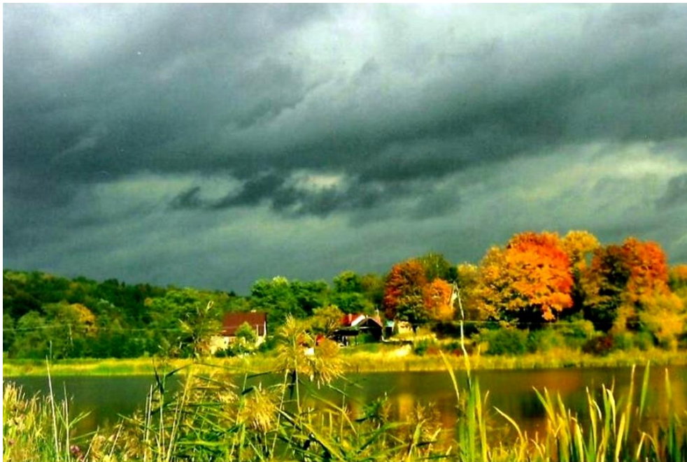
Fot. 2 Celejów. Dolina rzeki Bystrej

W dniu 28 września 2018 r. Marszałek Województwa Lubelskiego wydał decyzję znak: RŚ-IV.7422.24.2018.PL mocą której wyznaczone zostały granice obszaru i terenu górniczego „Celejów” obejmujące złoża wody termalnej. Granice te zostały naniesione w części graficznej dokumentu Studium. Geologiczne zasoby bilansowane, eksploatacyjne wynoszą 28 \text{ m}^3 / \text{h} .