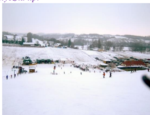
Fot. 7 Rąbłów, Ośrodek sportów letnich i zimowych „Nart Sport”