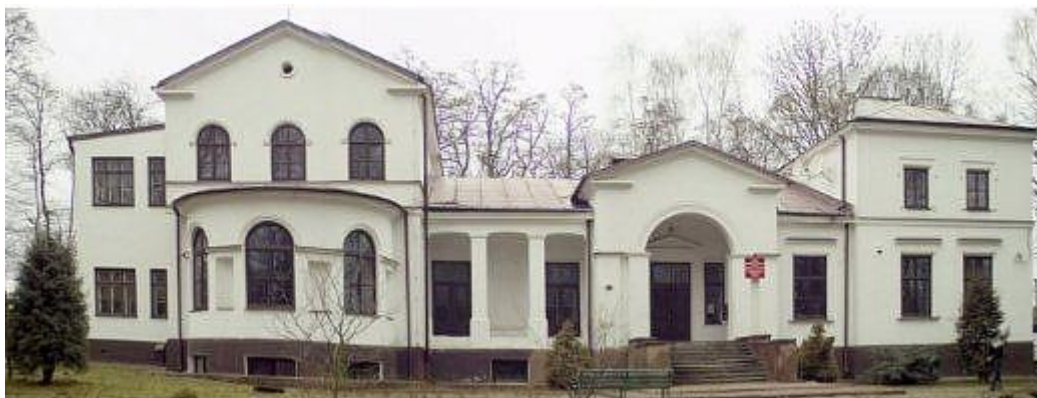
Fot. 15 Zespół pałacowo – parkowy w Kęble