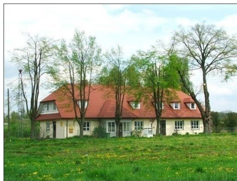
Fot. 19 Zespół podworski w Łopatkach