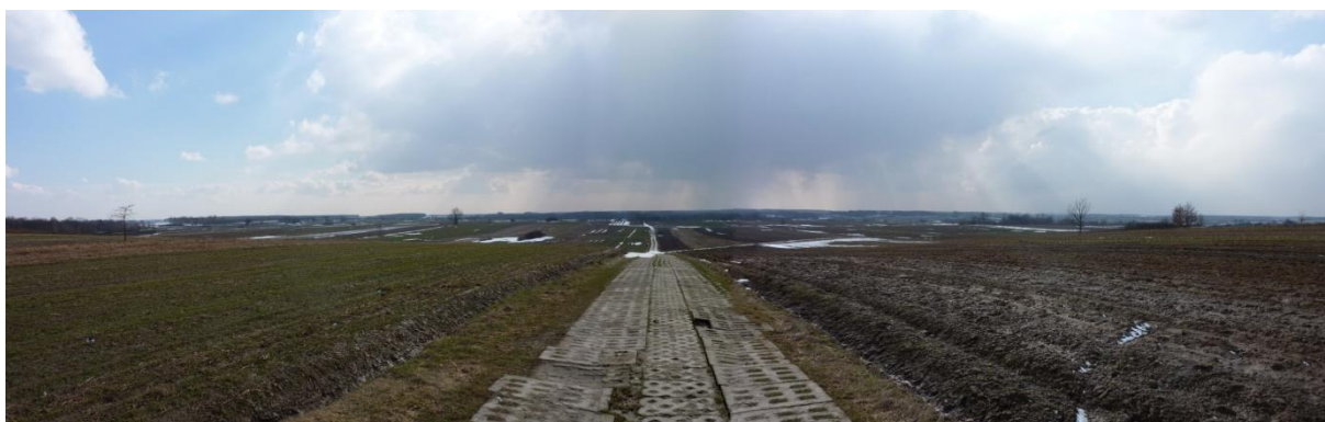
Fot. 25 Polkowszczyzna. Teren przeznaczony pod Zespół sportowo-rekreacyjny „Pole golfowe Polkowszczyzna”