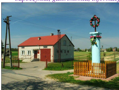
Fot. 6 OSP Rąbłów (dwarowery)