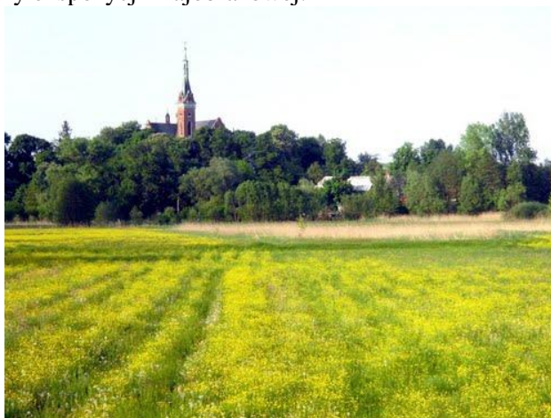
Fot. 1 Panorama na Wzgórzu Kościelne w Wąwolnicy (autor: Hasior)

W odniesieniu do tych stref obowiązuje ochrona przed: