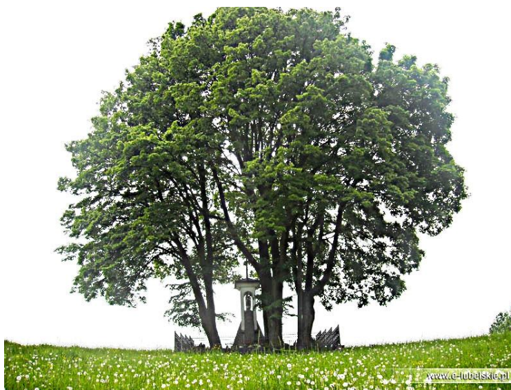
Fot. 22 Kapliczka "Na wzgórzu" Kębło (autor: e-lubelskie)