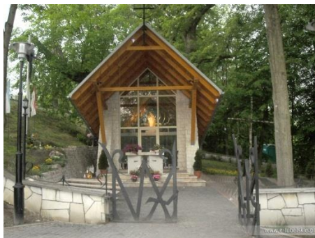
Fot. 5 Kapliczka „Na Zjawieniu” Kębło (e-lubelskie)