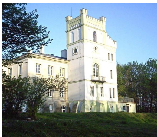
Fot. 17 Zespół pałacowo – parkowy w Celejowie