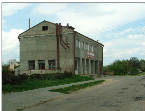
Fot. 3 OSP Karmanowice (autor: dwarowery) (autor: dwarowery)