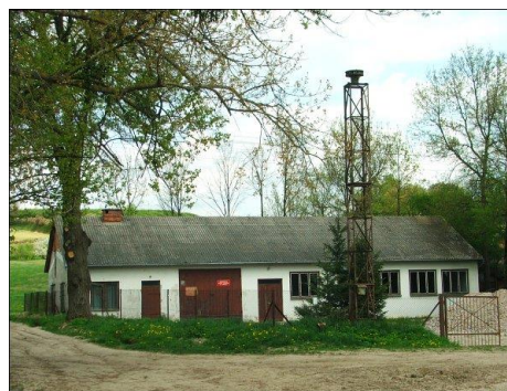
Fot. 4 OSP Zawada