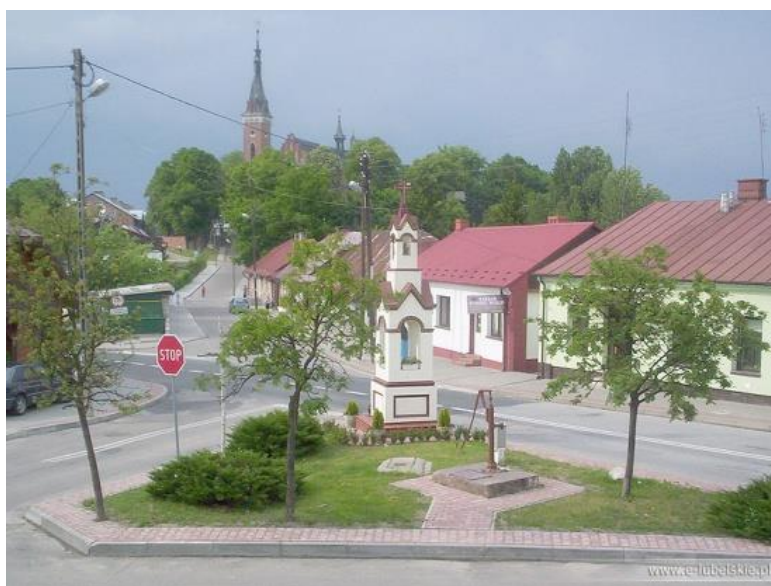
Fot. 8 Rynek Wąwolnica, skrzyżowanie ul. Dulęby z ul. Zamkową

Dla całości należy opracować profesjonalny projekt rewitalizacji w oparciu o wytyczne konserwatorskie określające m.in. obowiązujące parametry dla zabudowy.