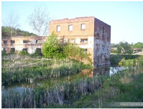
Fot. 21 Ruiny Papierni w