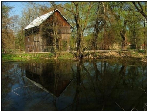
Fot. 20 Młyn w Ilki Celejowie