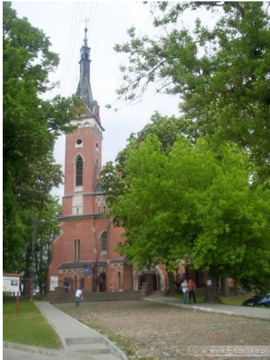
Fot. 11 Zespół sakralny na wzgórzu zamkowym w Wąwolnicy