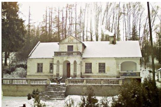
Fot. 18 Zespół dworski w Łąkach (autor: J.K. Wącior)