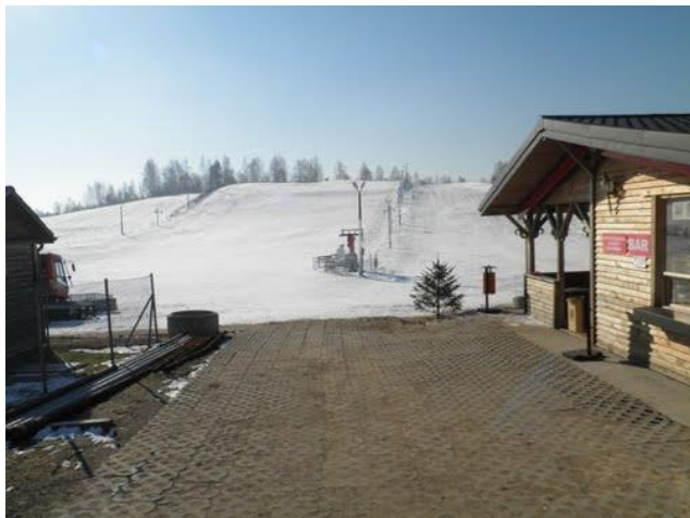
Fot. 23 Celejów. Stok narciarski