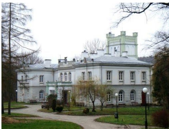
Fot. 16 Zespół pałacowo – parkowy w Celejowie