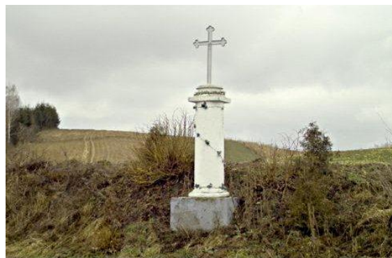
Fot. 13 Dwie kolumny tokańskie w Rąbłowie