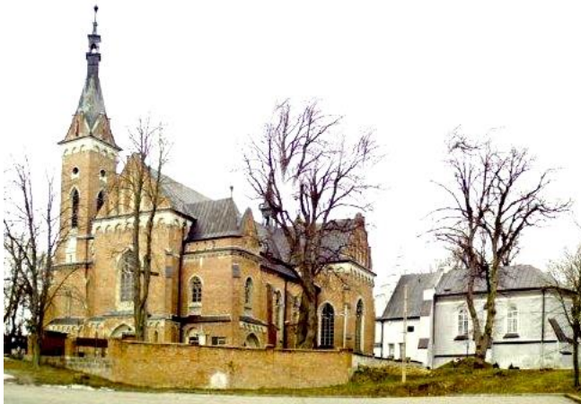
Fot. 12 Zespół sakralny na wzgórzu zamkowym w Wąwolnicy (autor: J.K. Wąciór)