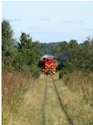
Fot. 24 Nałęczowska Kolej Dojazdowa